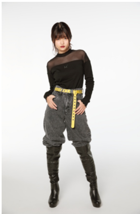
シースルー長袖Tシャツ (¥2,900)