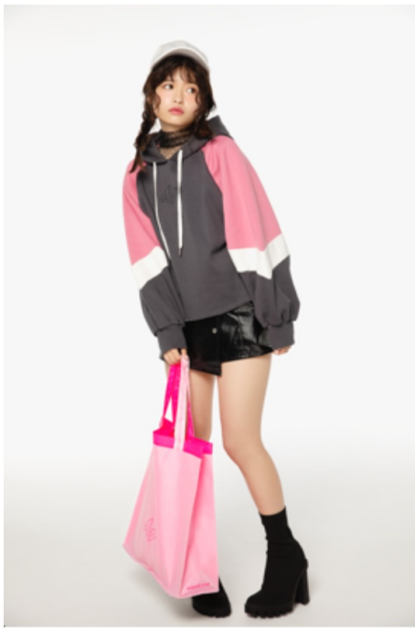
切り替えパーカー (¥4,900) 編み上げキャップ (¥2,900) レジャーバッグ (¥1,500)