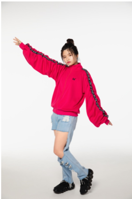
シャーリングトラックジャケット (¥4,900)