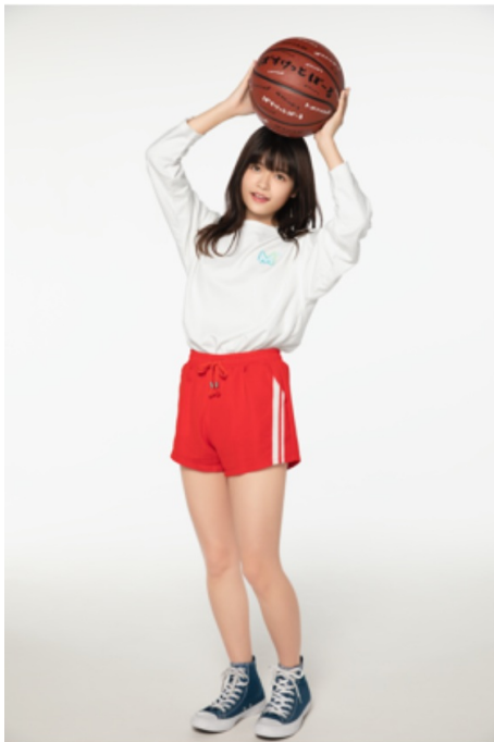
長袖Tシャツ (¥2,900) ばすけっとぼーる (¥3,600)